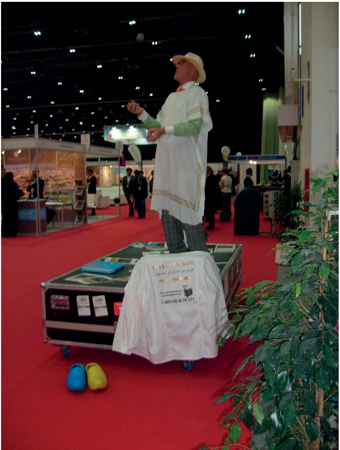
Dubai. International Property Show 2015.